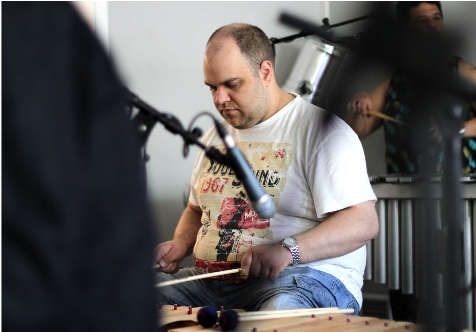
MANFRED LINDQVIST: TENOR XYLOPHONE