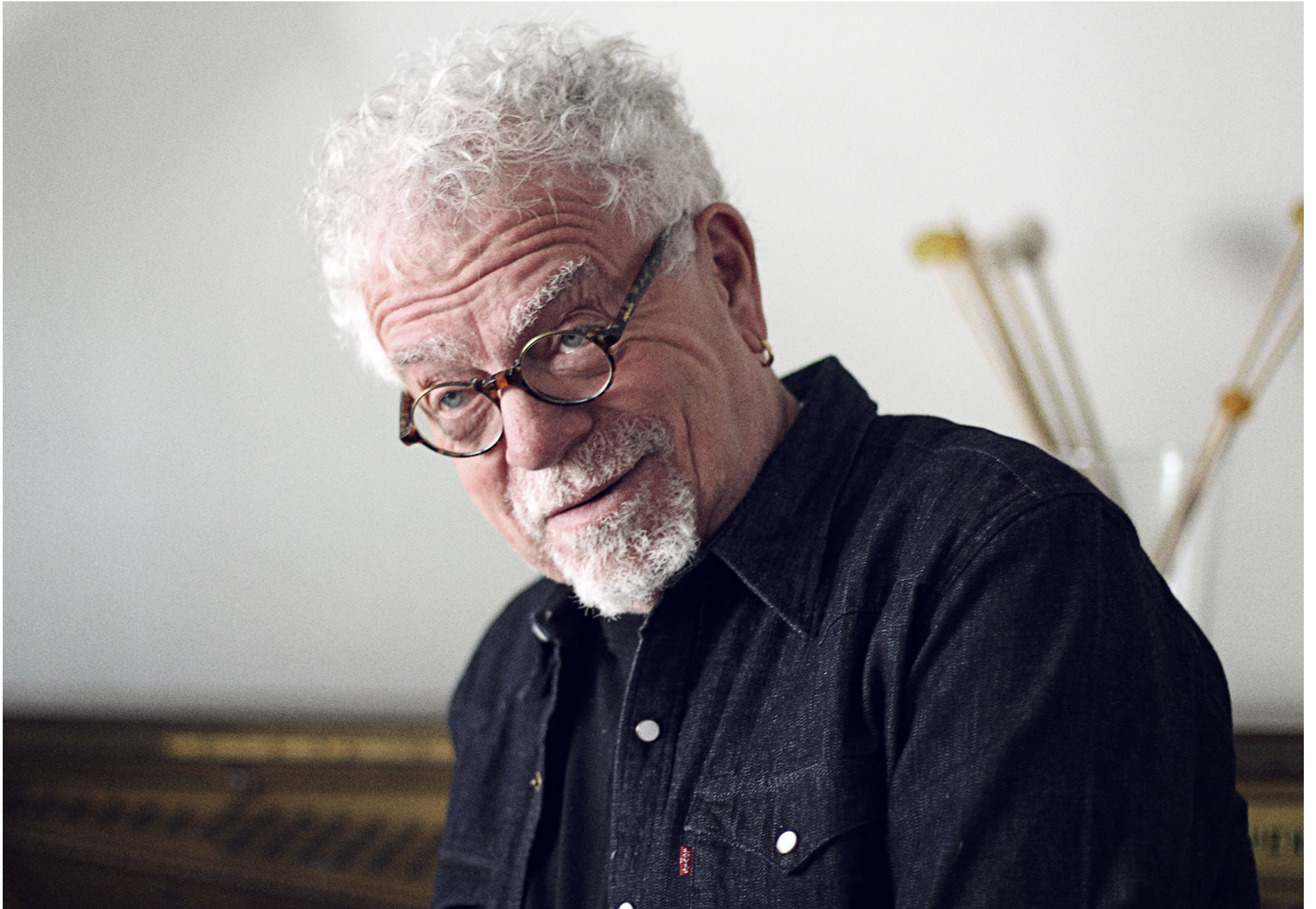
CHRISTER BOTHÉN: TENOR XYLOPHONE, PIANO, COMPOSER